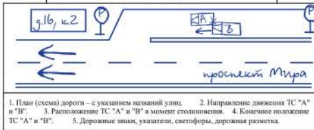
1. План (схема) дороги — с указанием названий улиц. 2. Направление движения ТС "А" в "В". 3. Расположение ТС "А" и "В" в момент столкновения. 4. Конечное положение ТС "А" и "В". 5. Дорожные знаки, указатели, светофоры, дорожная разметка.

** Составляется водителем транспортного средства "В" в отношении своего ТС.